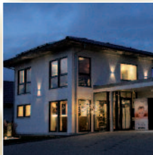
Lock Day Spa

Lock Day Spa Heunenburgerstraße 2 88499 Riedlingen T: +49 7371 9669270 F: +49 7371 9669271 info@lockdayspa.de www.lockdayspa.de