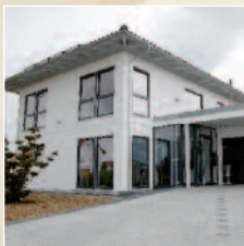
Lock Day Spa